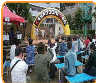
★コミュニティプラザ

それに伴い川口駅周辺では各ステージが設けられ、駅前を始め商店街やショッピングモールなど、12のステージで様々なジャンルの方々が演奏され、当社の前も会場となりフォークソングなど演奏が行われました。