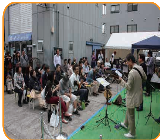
★花ぜんセレモニー前

それに伴い川口駅周辺では各ステージが設けられ、駅前を始め商店街やショッピングモールなど、12のステージで様々なジャンルの方々が演奏され、当社の前も会場となりフォークソングなど演奏が行われました。