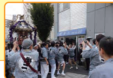
★花ぜんセレモニー前