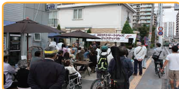
★イタリアのカフェテラスをイメージ

ステージ横では、栄町1丁目のビーズカフェが当日限定の ストリートビーズカフェ をオープン。