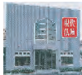
さいたま市浦和区岸町6-2-1 越谷市神明町3-217-1