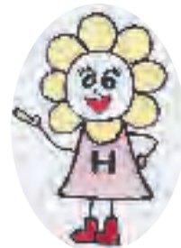
花ぜんセレモニー キャラクター 花ちゃん

花ぜんセレモニー 花ぜんセレモニー 花ぜんセレモニー 花ぜんセレモニー 花ぜんセレモニー 花ぜんセレモニー 花ぜんセレモニー 花ぜんセレモニー 花ぜんセレモニー