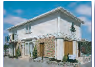
平成21年家族葬専用式場落成 f・リビング