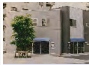
平成14年新社屋落成