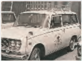
昭和35年花環業でスタート 1960年代の「コロナ」