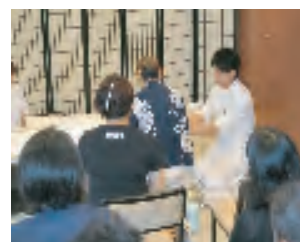
おくりびとの世界を見る