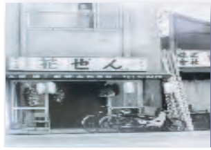
昭和44年、本町から栄町へ